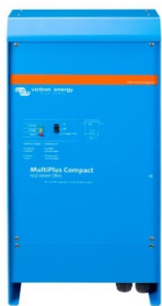
MultiPlus Compact 12/2000/80

Sind Systeme mit einem Color Control Panel an das Ethernet angeschlossen, kann auf sie zugegriffen werden und Einstellungen können aus der Ferne geändert werden.