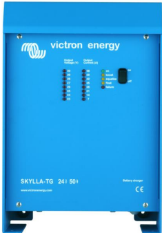
Skylla TG 24 50