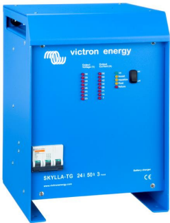
Skylla TG 24 50 3 phase

In unsere Broschüre „Immer Strom“ erfahren Sie mehr über Batterien und ihre Ladung. Sie erhalten die Broschüre kostenlos bei Victron Energy oder unter www.victronenergy.com im Internet.